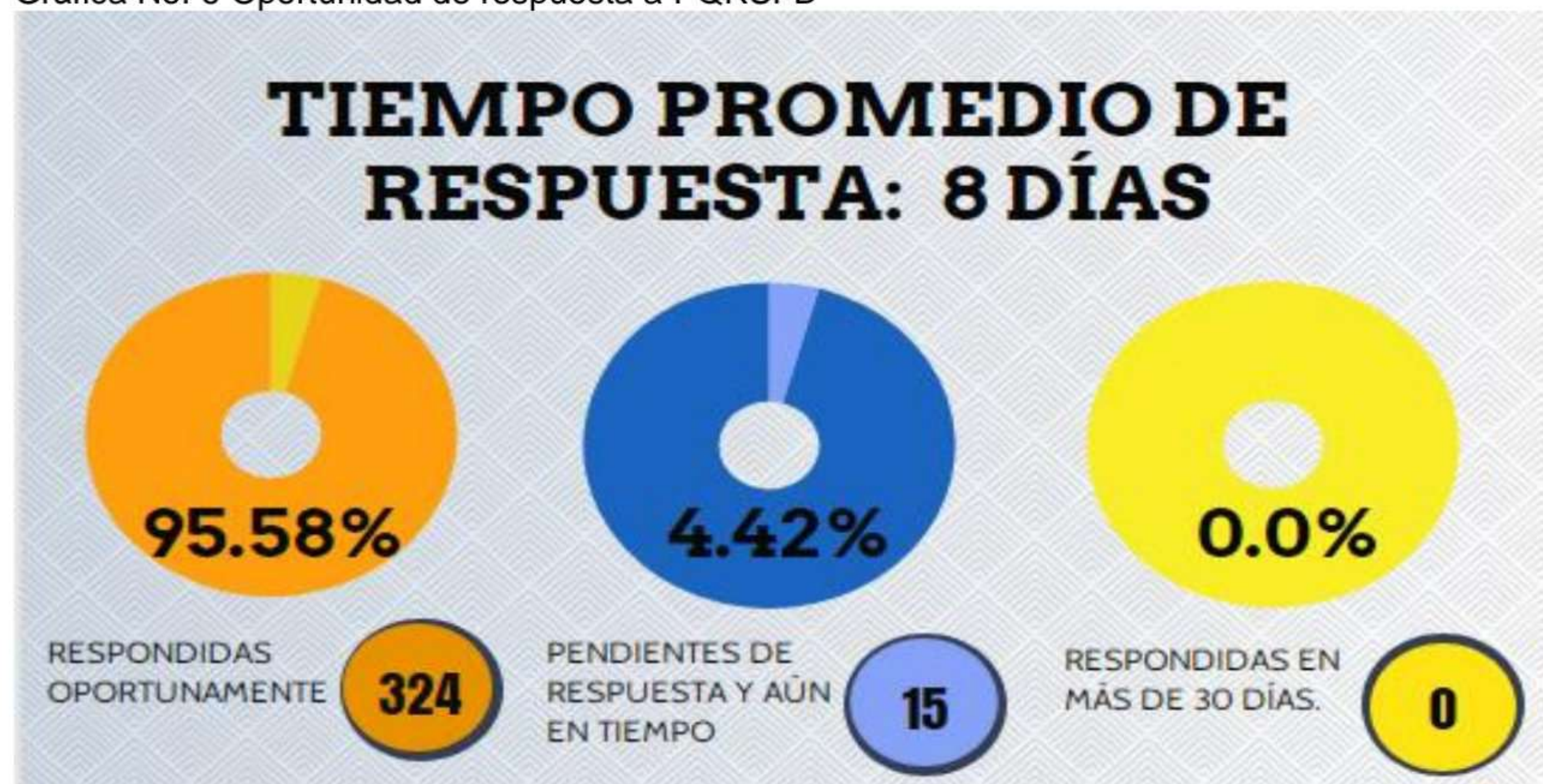
Gráfica No. 6 Oportunidad de respuesta a PQRSFD