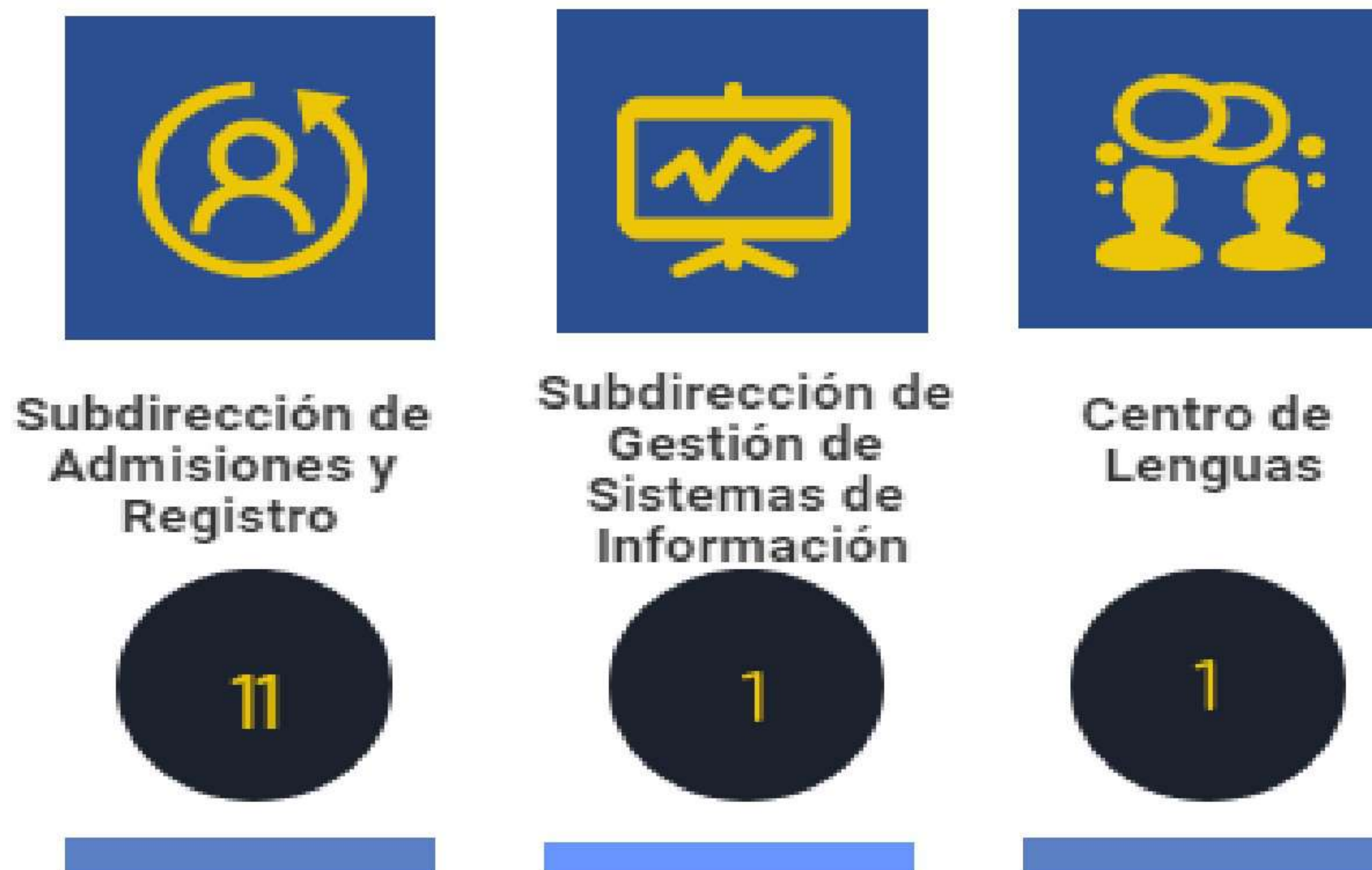
Gráfica No. 7 Solicitudes por falta de atención a una anterior