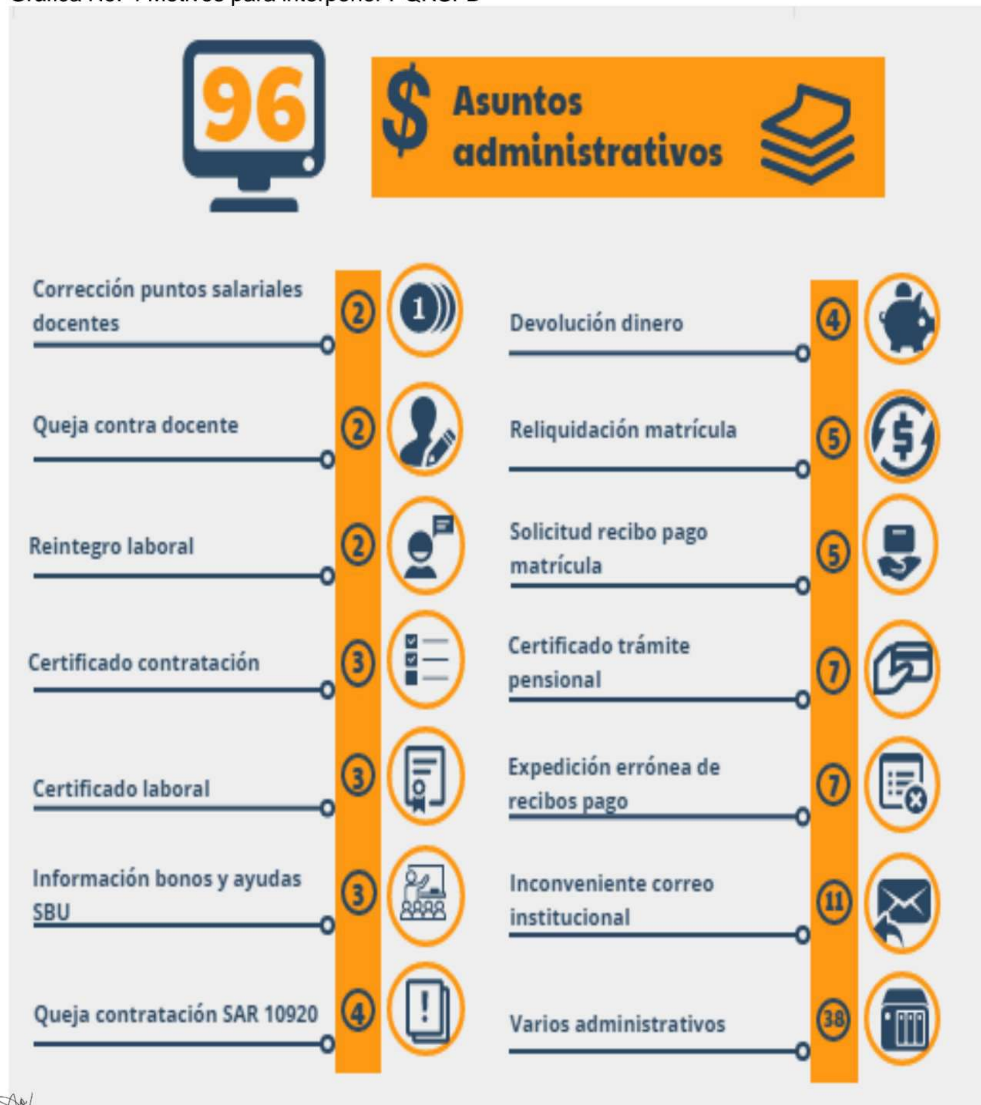
Gráfica No. 4 Motivos para interponer PQRSFD

A continuación, la gráfica No. 4 muestra el consolidado de PQRSFD presentadas durante el I trimestre de 2021, clasificadas como asuntos administrativos y académicos.