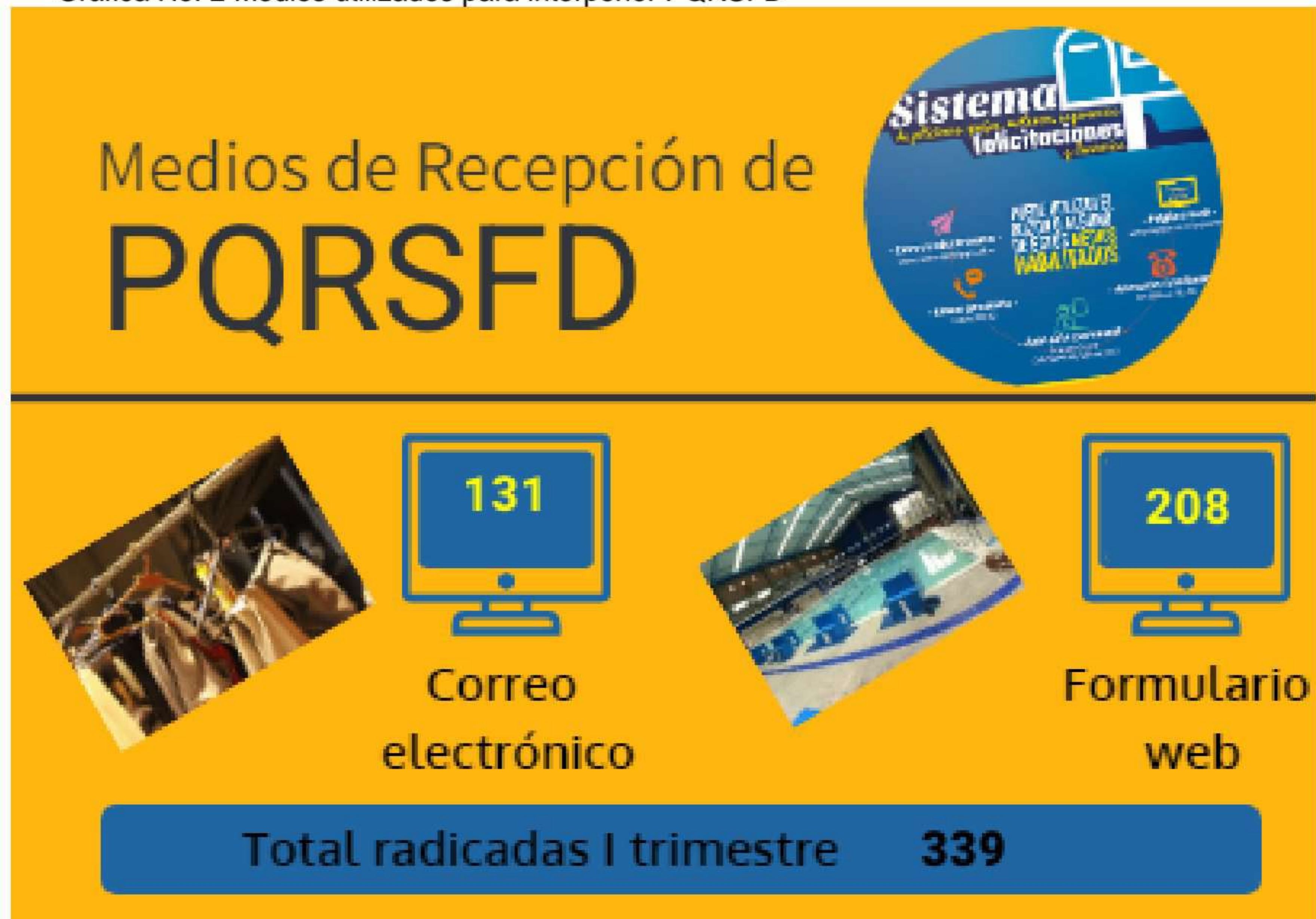
Gráfica No. 2 Medios utilizados para interponer PQRSFD