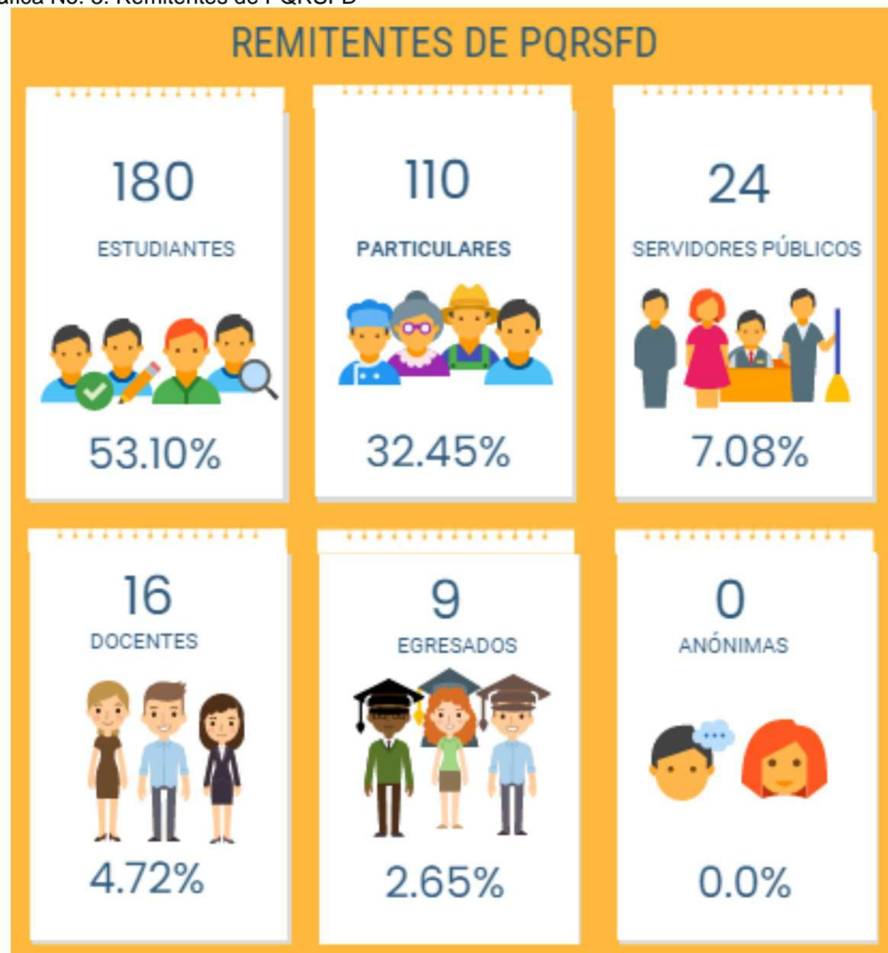
Gráfica No. 3. Remitentes de PQRSFD