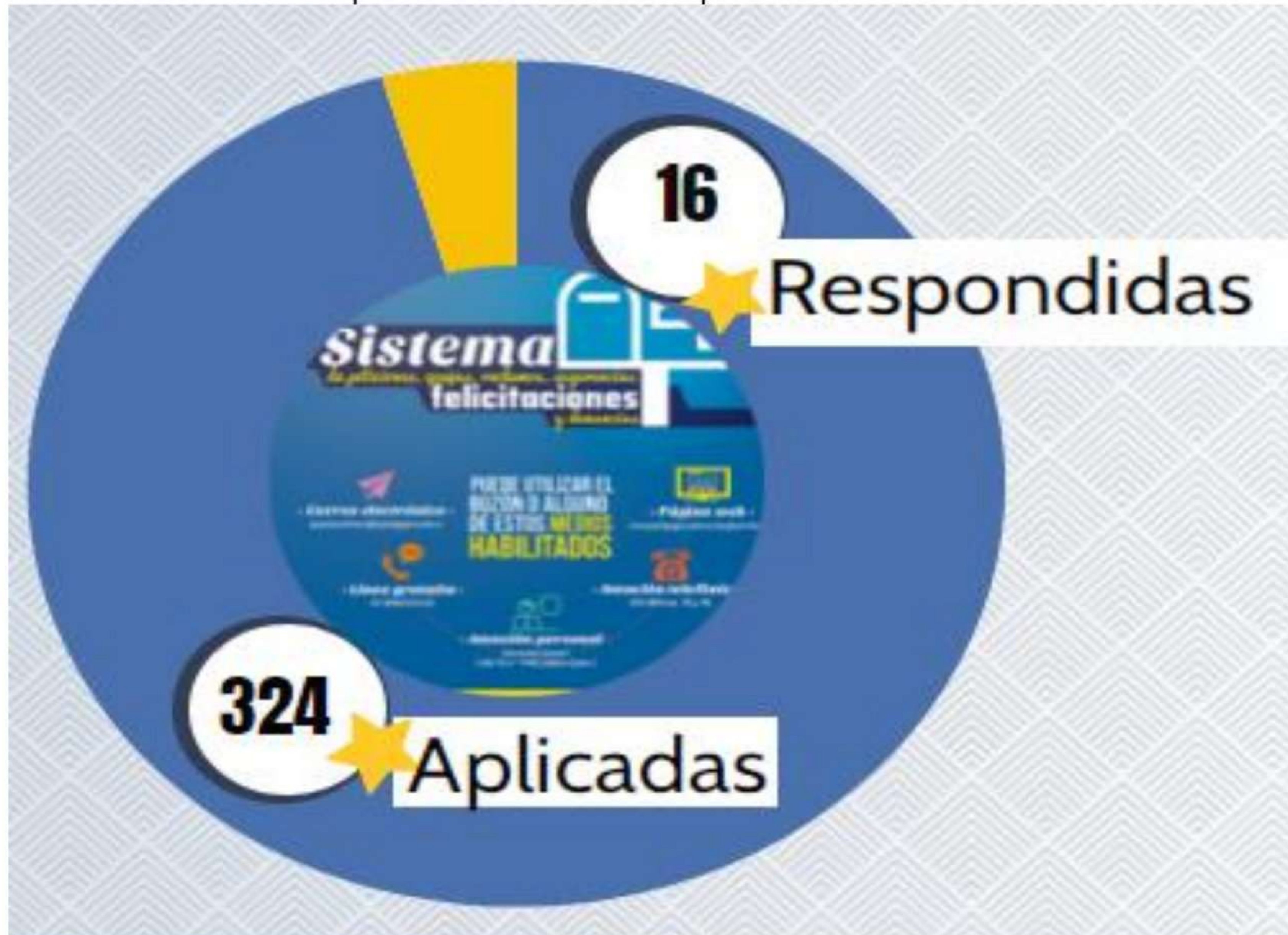
Gráfica No. 8 Encuestas aplicadas vs. Encuestas respondidas