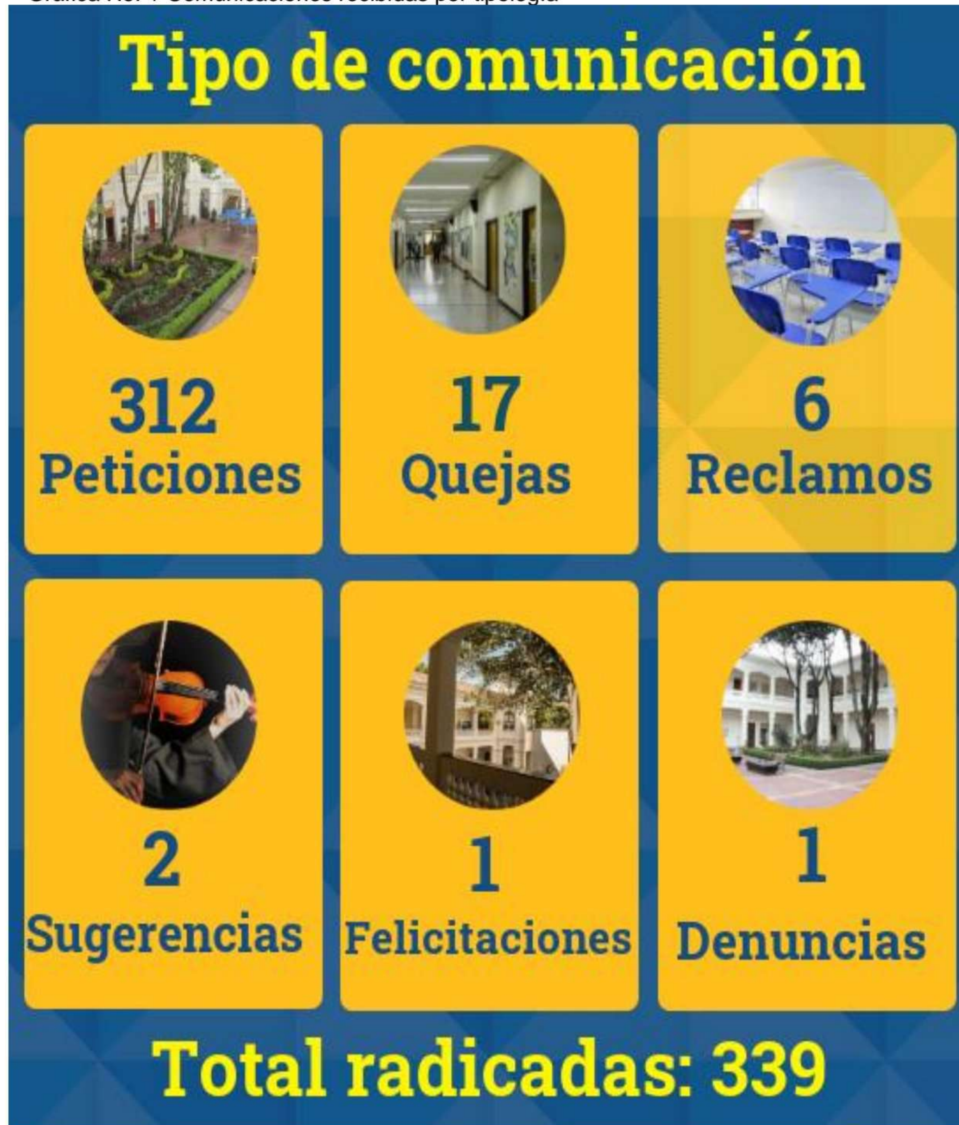
Gráfica No. 1 Comunicaciones recibidas por tipología